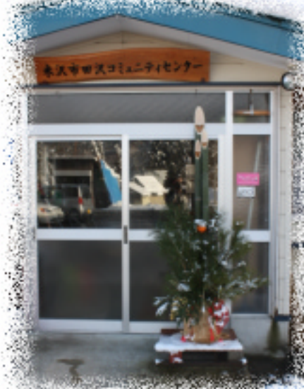
田沢コミセンに巨大門松出現!! ぜひ、見に来て下さい。